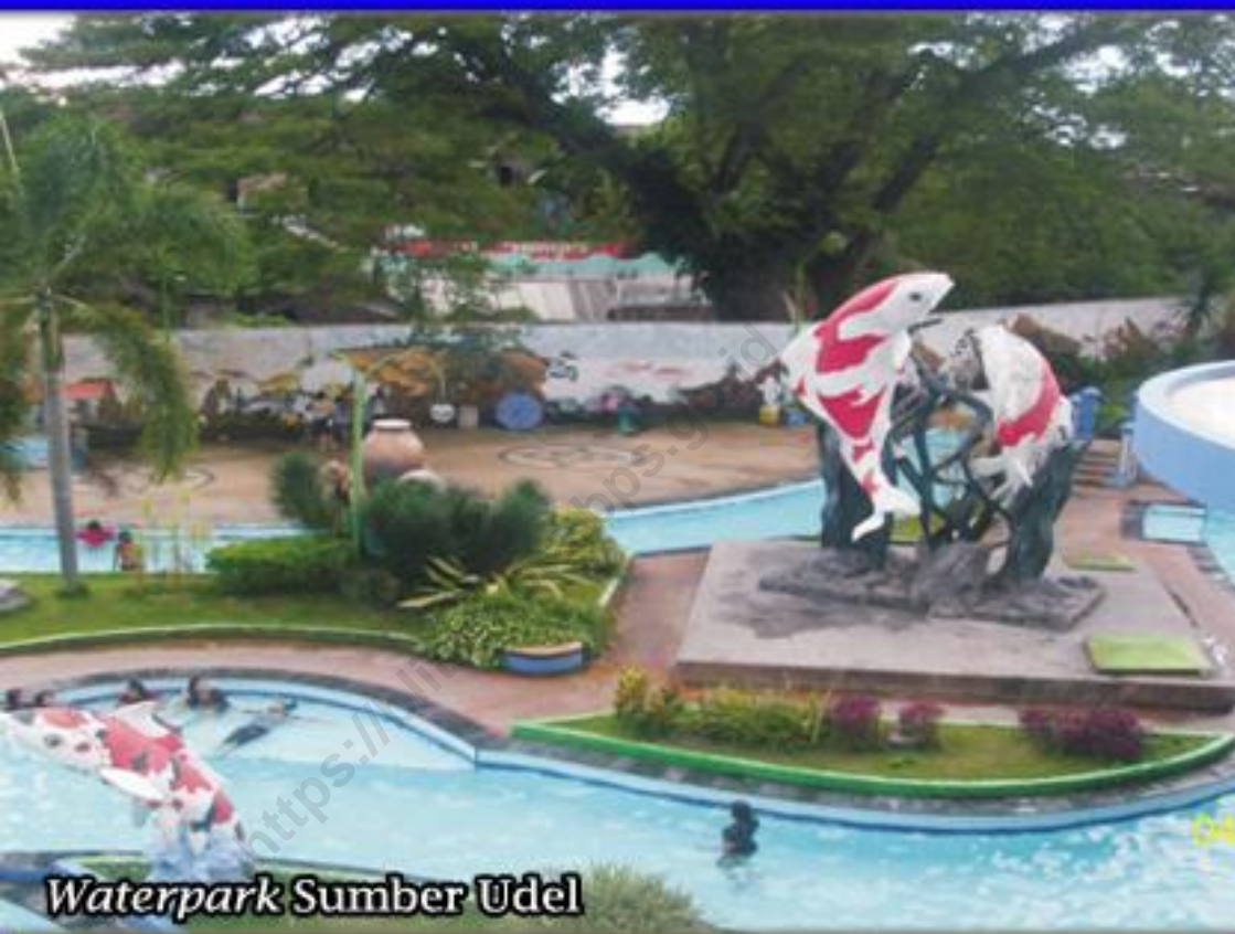
Waterpark Sumber Udel