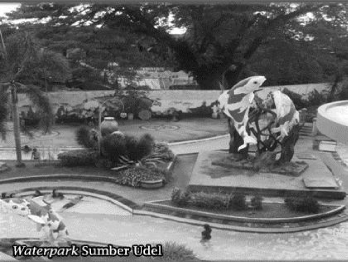
Waterpark Sumber Udel